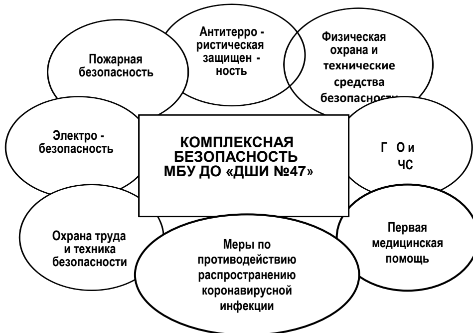
Схема комплексной безопасности учреждения

В 2021 году в учреждении, как и в целом по стране, особое внимание уделялось комплексной безопасности осуществления образовательного процесса, а так же применению дополнительных мер по противодействию распространения новой коронавирусной инфекции (COVID-19).