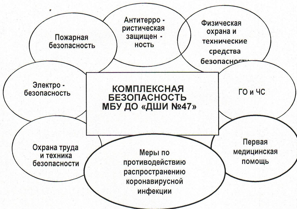
Схема комплексной безопасности учреждения

В 2020 году в учреждении, как и в целом по стране, особое внимание уделялось комплексной безопасности осуществления образовательного процесса, а так же применению дополнительных мер по противодействию распространения новой коронавирусной инфекции (COVID-19).